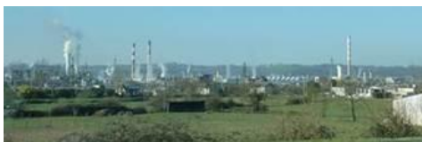
Plateforme Indsulacq (64)

Numéro d'appel – Plaintes Nuisances et odeurs – Induslacq : 05-59-92-21-02